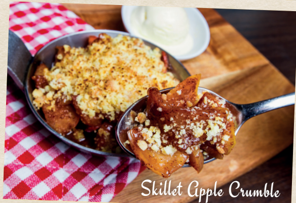
Skillet Apple Crumble