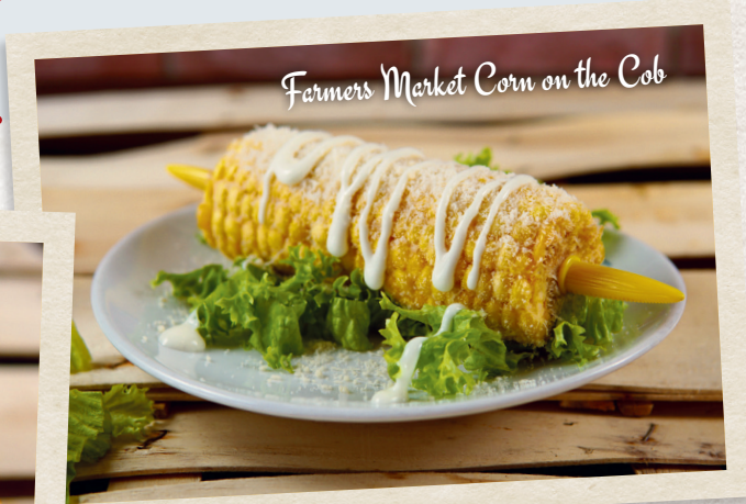
Farmers Market Corn on the Cob