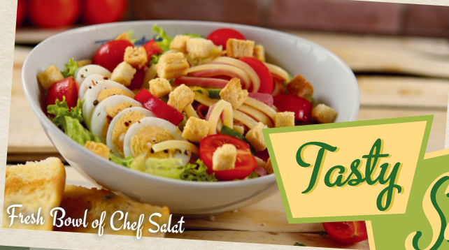
Fresh Bowl of Chef Salat