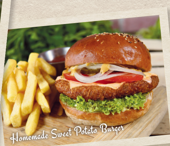
Homemade Sweet Potato Burger