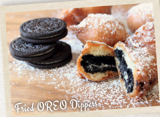
Fried OREO Dippers