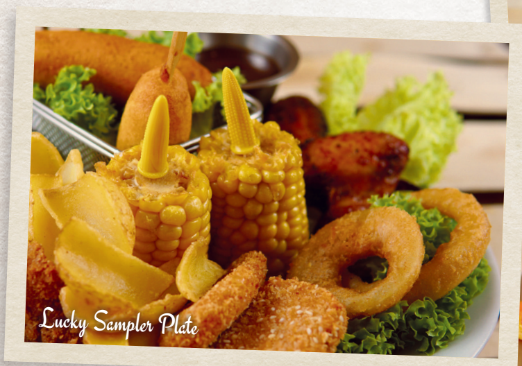
Lucky Sampler Plate