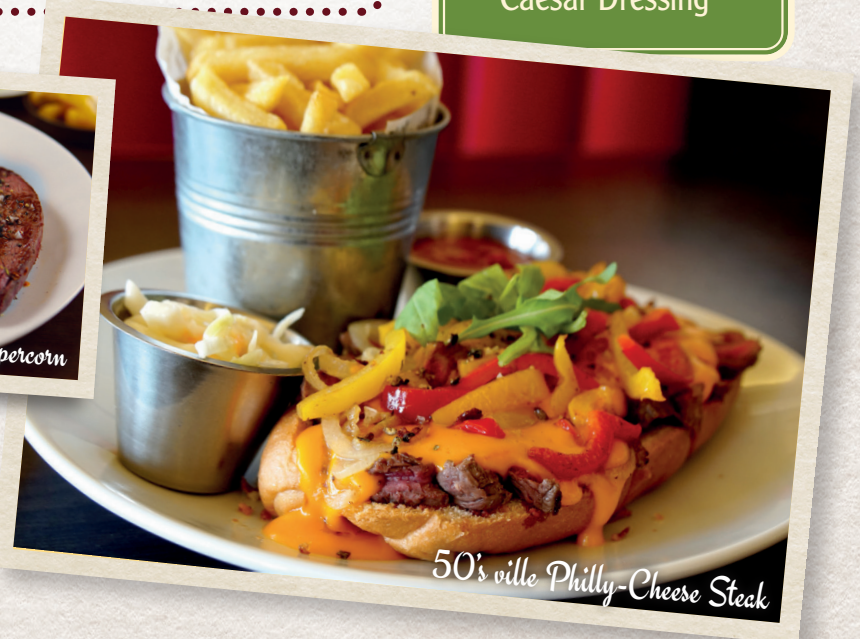
50's ville Philly-Cheese Steak