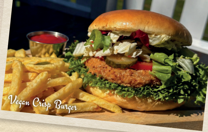
Vegan Crisp Burger