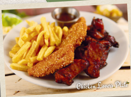
Chicken Lovers Plate

Gegrillte Hähnchenbrust, Bacon Crumbles 2,3 , gehobelter Grana Padano 1,2 , unser Special Caesar Dressing 2 , Zupfsalat, Tomate, Gurke, Paprika, Mais, Ei und Croutons. Inkl. Garlic Bread